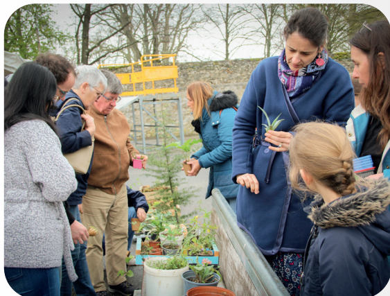
24 MARS 2024 TROC ET DON DU JARDINAGE SKATE PARK - RUE DIANE DE POITIERS