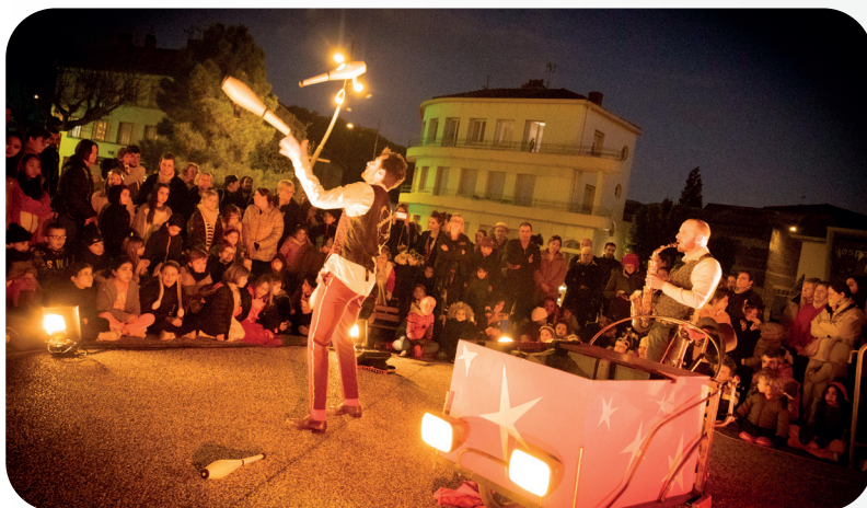
13 FÉVRIER 2024 MARDI GRAS MÉDIATHÈQUE ET SALLE DÉSIRÉ VALETTE