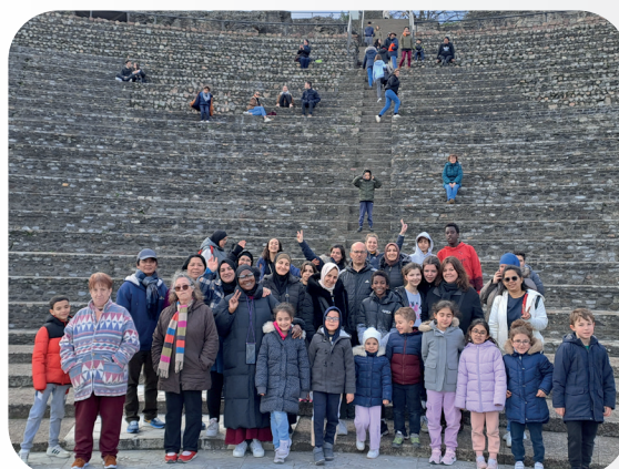
24 FÉVRIER 2024 SORTIE FAMILLE DE L'ECS MUSÉE LUGDUNUM À LYON