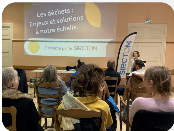
22 FÉVRIER 2024 RÉUNION PUBLIQUE COMPOST AVEC LE SIRCTOM EN MAIRIE