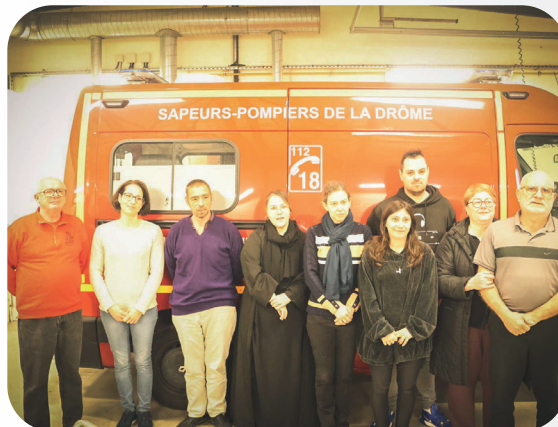
30 MARS 2024 FORMATION AUX GESTES QUI SAUVENT CENTRE D'INCENDIE ET DE SECOURS