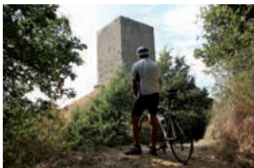
Site castral et tour (Albon)

Depuis le centre-ville historique de Saint-Vallier, la boucle quitte le Rhône à Ponsas pour s'élever à travers les gorges jusqu'aux mystérieuses Roches qui dansent. Puis, vous rejoindrez Saint-Barthélémy-de-Vals et le village de Claveyson et traverserez ensuite la vallée de la Galaure. Profitez d'une pause pour découvrir La Motte-de-Galaure et le prieuré Saint-Agnès. La route grimpe ensuite en direction de Fay-le-Clos. Avant de basculer vers la plaine de la Valloire vous profiterez de vues splendides sur les collines de la Drôme mais aussi du Pilat, de l'Ardèche et du Vercors. En descendant vous passerez à proximité de l'église Saint-Philibert et rejoindrez Albon, dominé par sa célèbre tour médiévale, berceau du Dauphiné. Direction Andancette pour rejoindre le